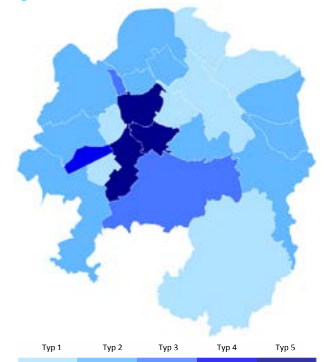
Abb.1: Stadt Hagen