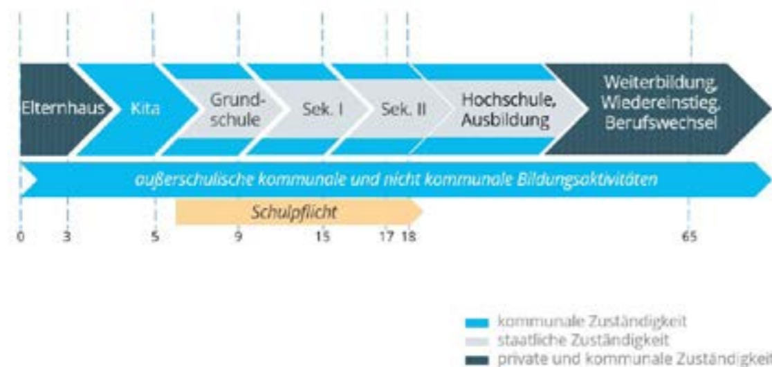
Abb.1: Nach Wilfried Lohre: „Kommunalstrukturen und kommunale Bildungssteuerung“ in Hans Döbert, Horst Weishaupt (Hrsg.): „Bildungsmonitoring, Bildungsmanagement und Bildungssteuerung in Kommunen. Ein Handbuch“, Waxmann Verlag GmbH, 2015, S.52.

Vor diesem Hintergrund ist es insbesondere beim Aufbau eines kommunalen Bildungsmanagements ebenso bedeutend wie komplex einen zur Situation vor Ort passenden Einstieg zu finden. Denn auf der einen Seite gibt es zahlreiche Handlungsfelder, die bearbeitet werden können, wie z.B. der gelingende Übergang von der Schule in den Beruf, die Integration von Neuzugewanderten oder die Bündelung von Beratungsleistungen vor Ort. Auf der anderen Seite fehlt es der Kommu-