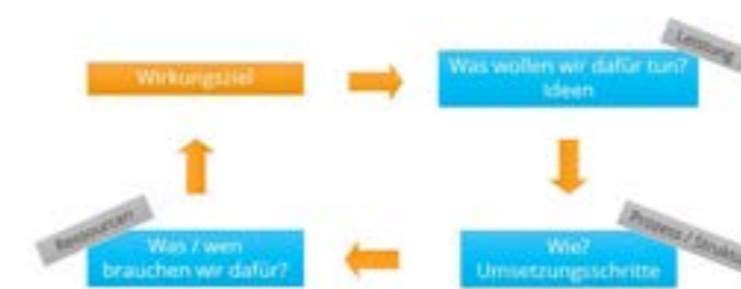
Abb. 2: Kommunales Zielsystem (KGSt), eigene Darstellung